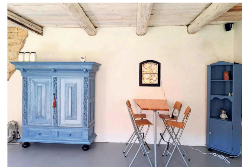
Een deel van de ontbijtzaal.